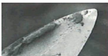
VIER KEER GEBRUIKT