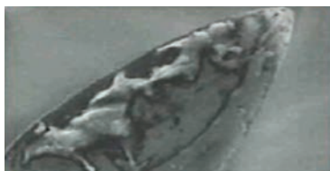
TIEN KEER GEBRUIKT